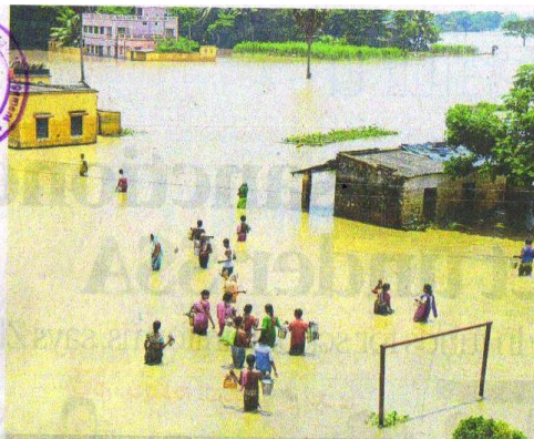
Rain havoc in many states P12

Mangaluru, Wednesday August 2, 2017 Pages 18 Vol 20 No 213 ₹ 6.00 M... www.deccanherald.com